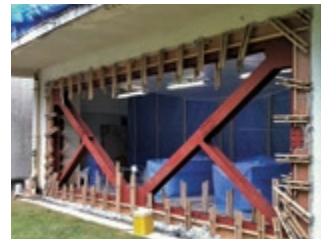
耐震補強充填工事