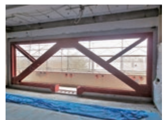
耐震補強充填工事