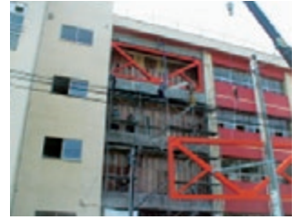
鉄骨ブレース組立