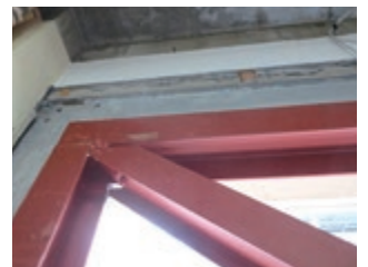
耐震補強充填工事