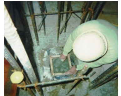
鉄骨柱基礎ベースモルタルの施工状況