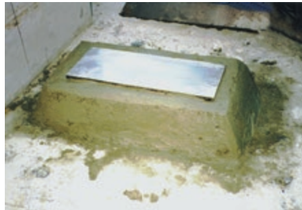
機械基礎/パッドの施工状況