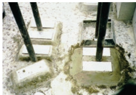
機械基礎/パッドの施工状況