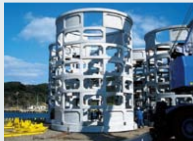
コンクリート部材組立完了