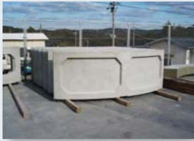
コンクリート部材製作