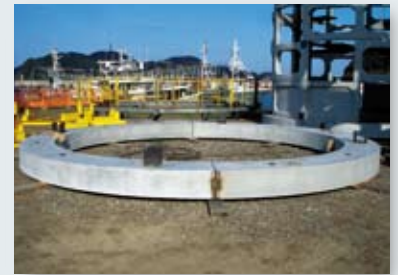
下端リング組立完了