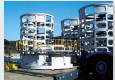
コンクリート部材組立