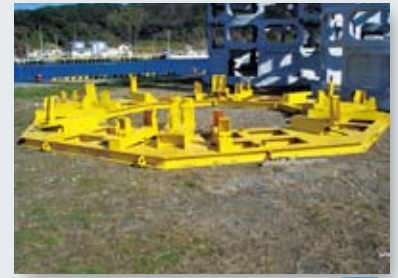
下端リング組立専用足場