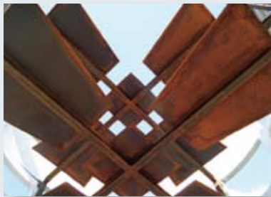
鋼製部材組立完了