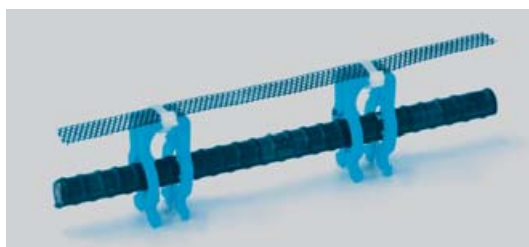
■鉄筋クリップ工法（鉄筋クリップ#5）