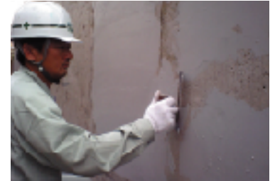
リフレベースWパテ塗布状況