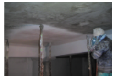
リフレベースW塗布状況 (リシガン吹付け施工)