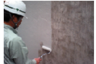
リフレベースW塗布状況 (ローラー施工)